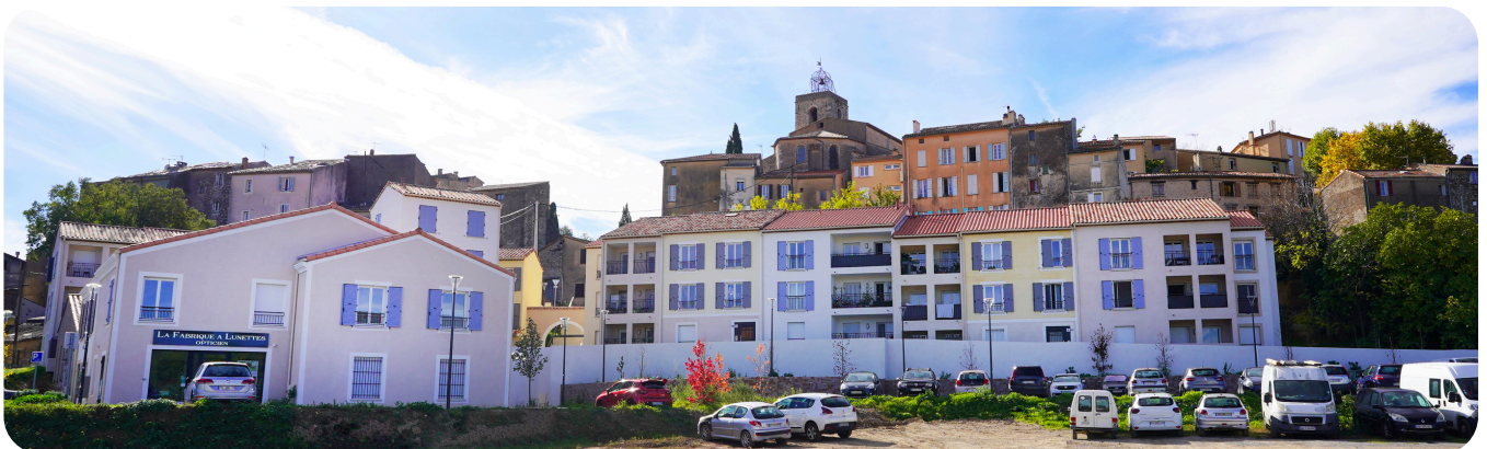
Rés. les Safraniers / Var Habitat / Flayosc

Si votre situation correspond à un des critères évoqués en page précédente et que vous remplissez les conditions, alors vous pouvez déposer un recours DALO, selon les étapes décrites en pages suivantes.